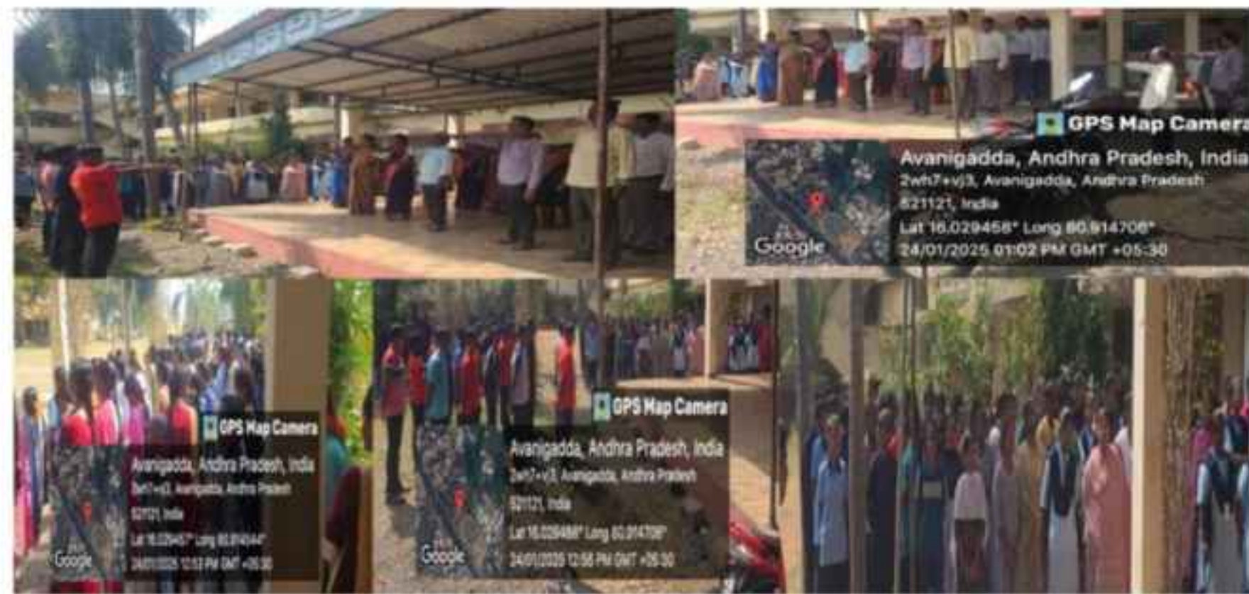
NSS VOLUNTEERS CONDUCTED PLEDGE AT VARIOUS SCHOOLS AND HOSTELS AT AVNAGADDA