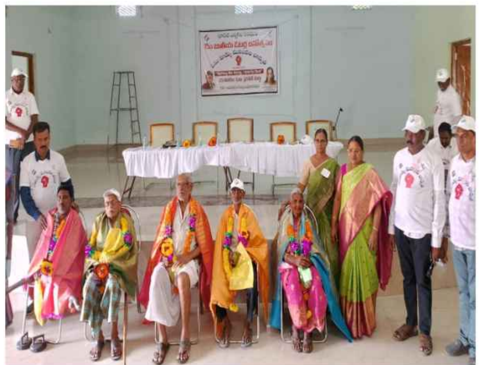
On the occasion of 15th National Voter's Day, the awareness program organized at Avanigadda Tehsildar Office was attended as speaker on 25/01/2025