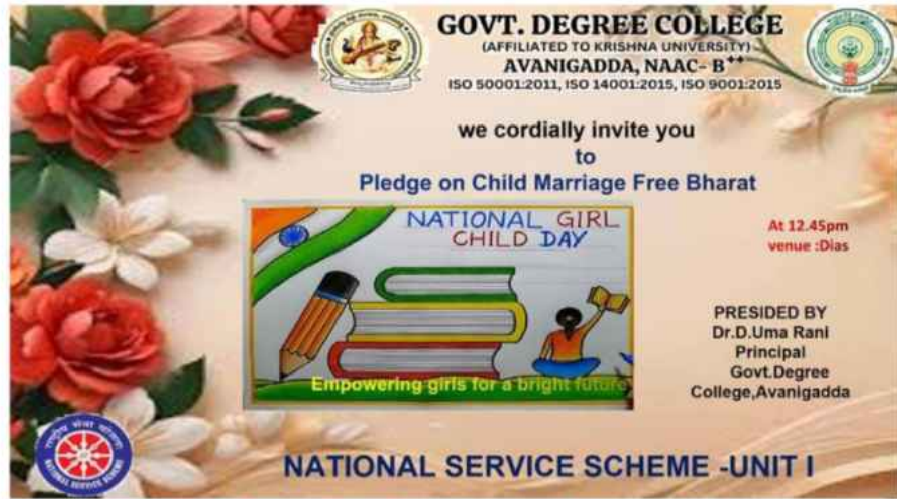
GDC AVANIGADDA NSS UNIT I GIRLCHILD DAY----24/01/2025